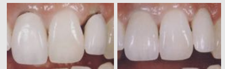
Metallkeramik-Kronen mit dunklen Rändern (links) und ästhetische Kronen aus reiner Keramik (rechts).

Wenn Sie wirklich schöne Zähne wollen, sollten Sie sich für Kronen und Brücken aus reiner Keramik entscheiden.